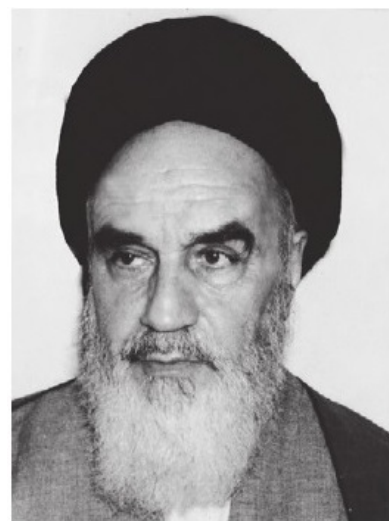
امام خمینی در دیدار با تیمسار فلاحی جانشین ستاد مشترک ارتش جمهوری اسلامی ایران: من بسیار متأسفم از اینکه گاهی به واسطه خیانت یا ندانم‌کاری بعضی از ارتشی‌ها این بهانه به دست اشخاص فاسد می‌دهد که ارتش را تضعیف کند.

«تمام این مسائل را برای ما پیش می‌آورند. یک صد نفر، دویست نفر فرض کنید وقتی که در یک گروهی فاسد شدند و خیالی داشتند، در عین حالی که خود ارتش با قدرت جلو اینها را گرفت و این طور توطئه‌ها را کشف کرد، و همین طور پاسدارها هم کمک کردند و همه با هم این توطئه را خنثی کردند، نباید در نظر اشخاص بیاید که ارتش چطور است. این ارتش همان است که خودش این کار را کرده و همان است که کردستان را و جاهای دیگر را به قوه خودش با سپاه پاسداران هماهنگ شدند و کارها را انجام دادند.»